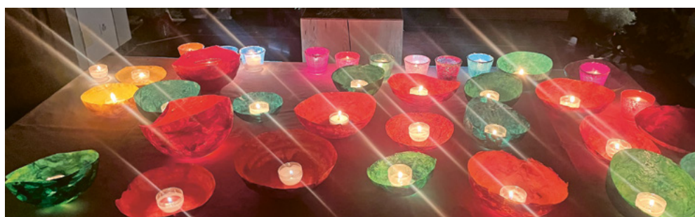
Advents- und Weihnachtszeit im Wartau