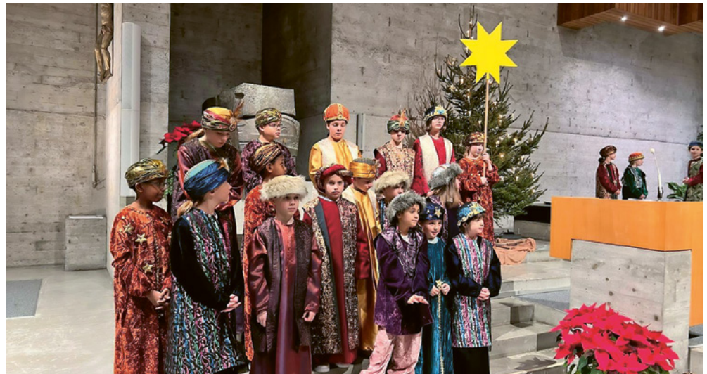
Aussendung Sternsinger Buchs-Grabs