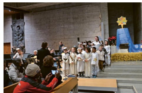
Weihnachtsmusical mit Cuorini in Buchs