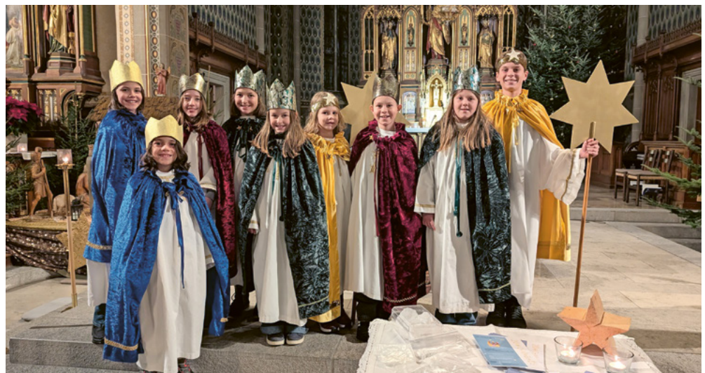
Die Sternsinger in Gams haben dieses Jahr insgesamt 6759.20 Franken (inkl. Kollekte) gesammelt. Allen ein herzliches Dankeschön!

Weitere Infos finden Sie unter: www.religionspaedagogik-sg.ch oder bei der Fachstelle Katechese und Religionsunterricht (fakaru), 071 227 33 60, fakaru@bistum-stgallen.ch .