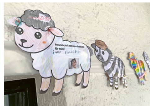
Jesus, der gute Hirte