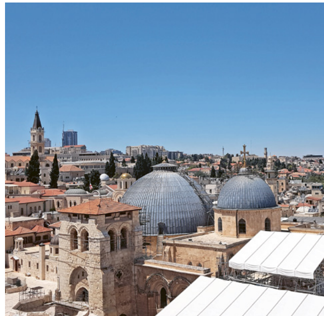
Grabeskirche Jerusalem. Unter der grossen grauen Kuppel liegt das Grab.

Der Herr schenke ihnen Licht und Freude bei IHM, den Angehörigen und Freunden Trost und Kraft.