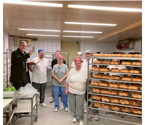
Agathabrotsegnung im Volg

Im Gottesdienst vom 15. Februar, mit Vorstellung des Opferkerzenprojektes 2025, ergab die Kollekte zugunsten des Fördervereins für Kinder mit seltenen Krankheiten 1039 Franken. Herzlichen Dank allen Spender*innen! Der Förderverein wird dieses Jahr auch über den Verkauf der Opferkerzen in der Pfarrkirche, der Mater Dolorosa-Kapelle, der Gasenzen-Kapelle und der Grotte Müntschenberg unterstützt. Auch die Einnahmen aus der Kaffeestube nach den Gottesdiensten gehen zugunsten dieses Projektes.